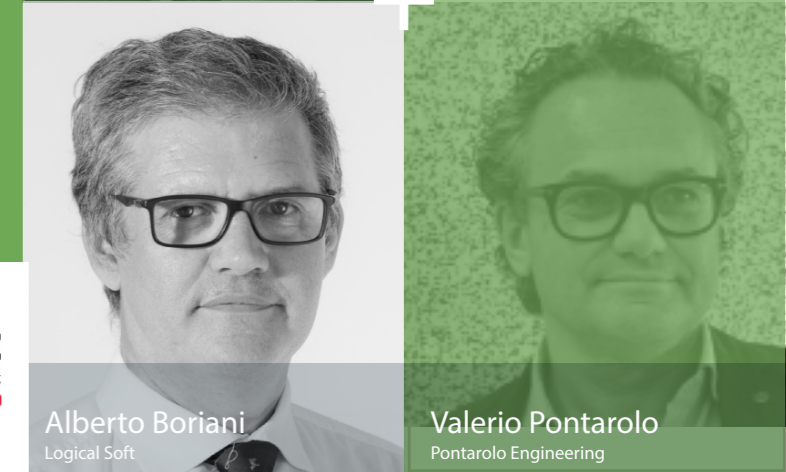
Alberto Boriani Logical Soft